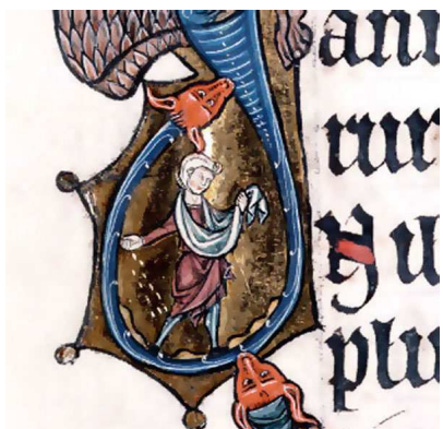
Parabole du semeur Evangélaire à l'usage de Cambrai vers 1266

La version de Marc de la parabole du semeur est la plus connue. Luc s'adosse à ce texte. Il insiste sur le thème de la Parole de Dieu à accueillir, à garder et à transmettre. Luc est le seul à ajouter que, si le diable vient pour enlever la parole du cœur de ses auditeurs, c'est « de peur qu'ils ne croient et ne soient sauvés ». Ce thème du salut qui est donné aujourd'hui par et en Jésus se retrouve tout au long de l'évangile de Luc.