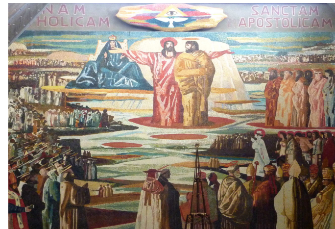
Mosaïque centrale de la Basilique de l'Annonciation à Nazareth Illustrant les dimensions mariale et pétrinienne de l'Eglise.

Dès lors, on comprend pourquoi Jésus dans l'Evangile s'entoure d'hommes et de femmes, faisant des Douze ses collaborateurs dont il se sert pour communiquer la grâce des sacrements à son Eglise-Epouse dont il est la Tête et l'Epoux, et que ces mêmes collaborateurs, tout au long de l'histoire de l'Eglise, ont vocation à représenter. Les saintes femmes, quant à elles, sont les premières bénéficiaires des dons du Christ-Epoux, à charge pour elles, dans la liberté, de les faire fructifier comme l'Eglise-Epouse. La femme ne devait pas être utilisée par Dieu dans la communication ministérielle de la grâce, pour que celle-ci puisse être perçue comme son initiative à lui, libre et transcendante. Dieu demande à la femme de recevoir la grâce sacramentelle par le ministère d'un homme qui n'est que son représentant à Lui. Ce ministère n'est pas un privilège, il est un service sacramentel de l'Eglise par un de ses enfants qui vit de sa vie baptismale avec tous les autres fidèles du Christ. Or la femme qui seule fournit à l'Eglise son image adéquate d'Epouse (cf. Ap 12,1) est d'après saint Paul « la gloire de l'homme » (1 Co 11, 7), car elle l'aide* à accueillir la grâce divine, dont elle est « cohéritière avec lui » (1 P 3,7), et à la faire fructifier. Pour cette raison le pape Jean-Paul II a pu affirmer que « la dimension mariale de l'Eglise précède sa dimension pétrinienne. » (Mulieris dignitatem n° 27)